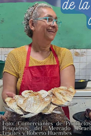
Foto: Comerciantes de Productos Pesqueros del Mercado Israel Lewites y Roberto Huembes

de la Semana del 22 al 28 de abril del 2024