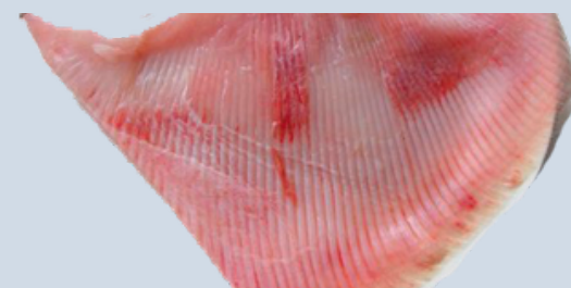
Nombre Común: Raya