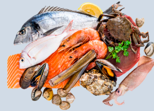
Nombre Común: Mariscada