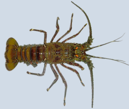
Nombre Común: Langosta Entera del Pacífico