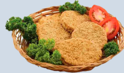
Nombre Común: Torta de Pescado