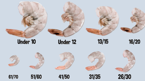
Nombre Común: Variedad de tallas Camarones