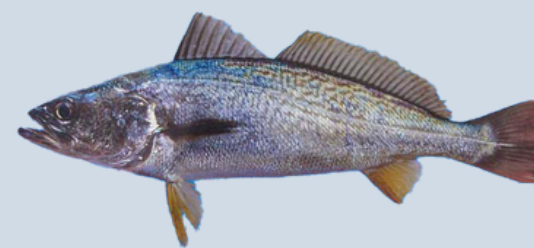
Nombre Común: Corvina