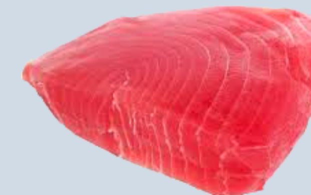
Nombre Común: Atún