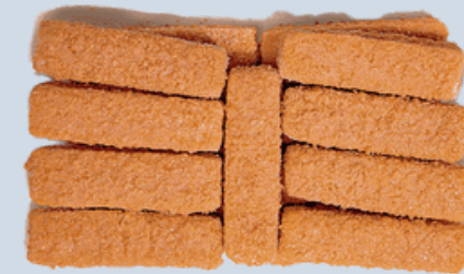
Nombre Común: Dedos de Pescado