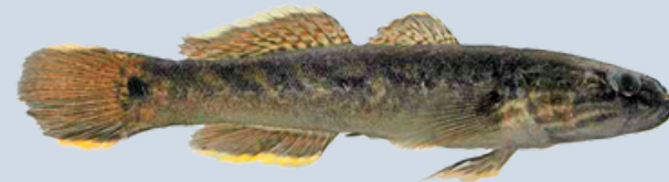
Nombre Común: Guabina