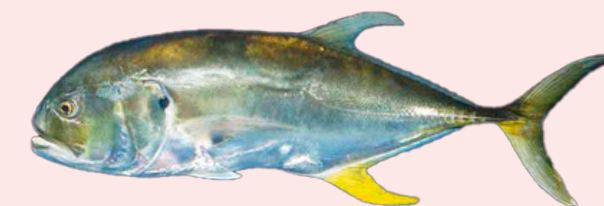
Nombre Común: Jurel