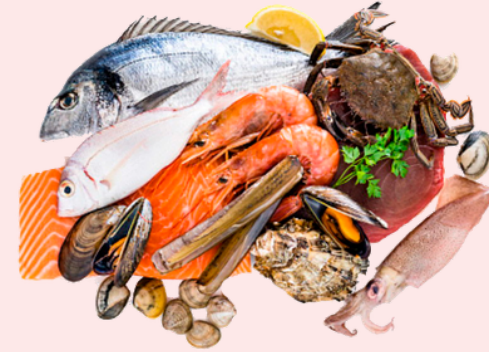
Nombre Común: Mariscada