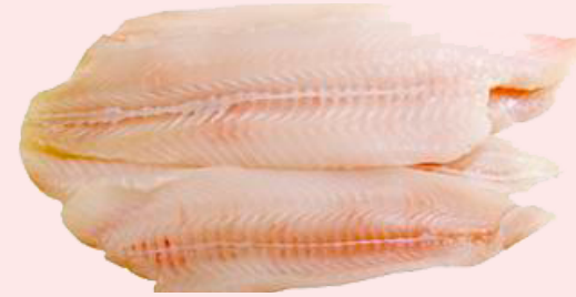
Nombre Común: Lengado