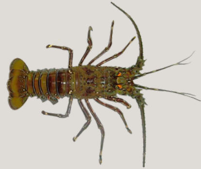
Nombre Común: Langosta Entera del Pacífico