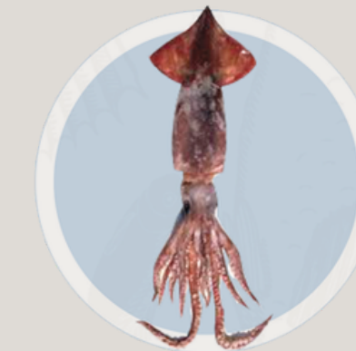
Nombre Común: Calamar