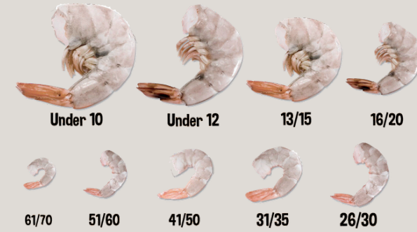
Variedad de tallas Camarones