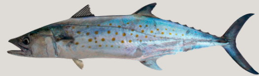
Nombre Común: Macarela