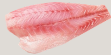
Nombre Común: Corvina