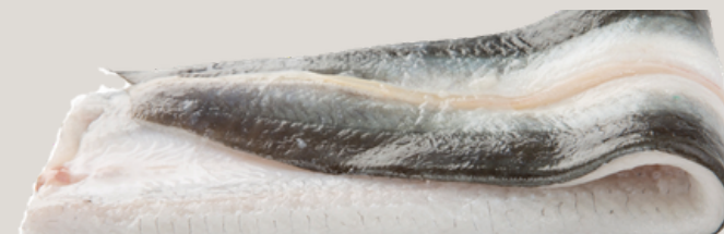
Nombre Común: Anguila