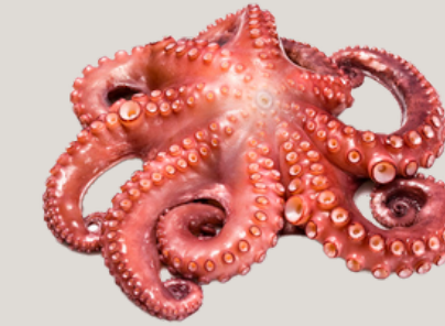
Nombre Común: Pulpo