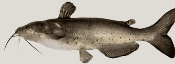
Nombre Común: Bagre