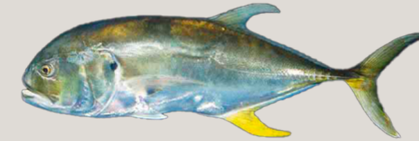
Nombre Común: Jurel