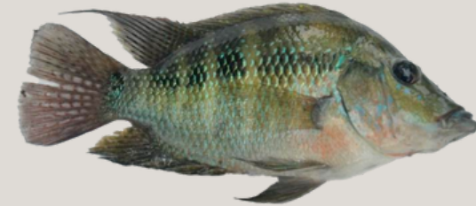
Nombre Común: Mojarra