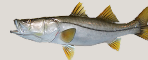
Nombre Común: Robalo