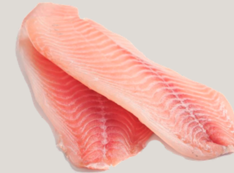
Nombre Común: Tilapia