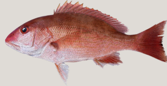
Nombre Común: Pargo Rojo