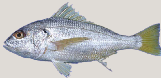
Nombre Común: Ruco