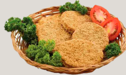
Nombre Común Torta de Pescado