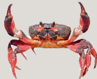
Nombre Común: Punche