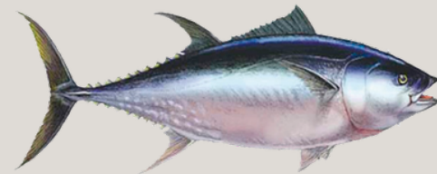
Nombre Común: Atún