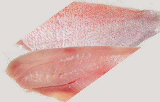
Nombre Común: Pargo