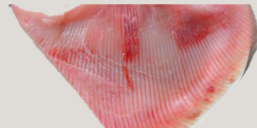
Nombre Común: Raya