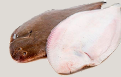
Nombre Común: Lenguado