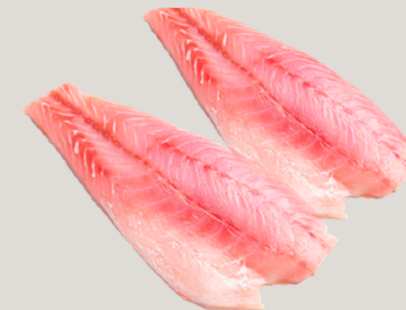
Nombre Común: Mero