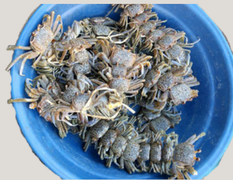
Nombre Común: Champainano