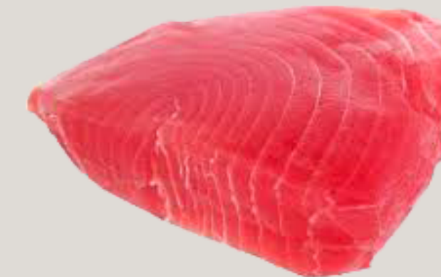
Nombre Común: Atún