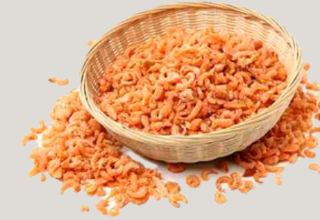
Nombre Común: Chacalín Seco