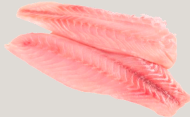
Nombre Común: Robalo