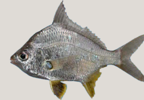
Nombre Común: Palometa