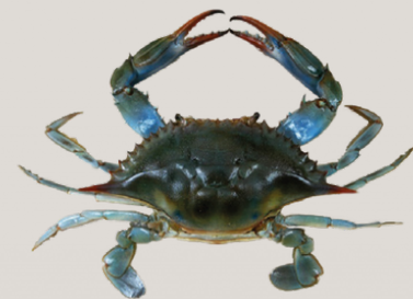
Nombre Común: Jaiba