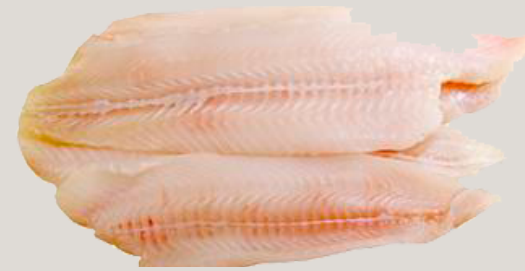
Nombre Común: Lengudo