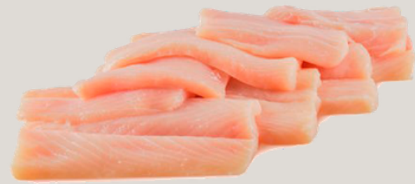
Nombre Común: Tiburón