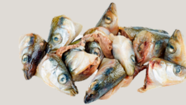
Nombre Común: Cabeza de pescado