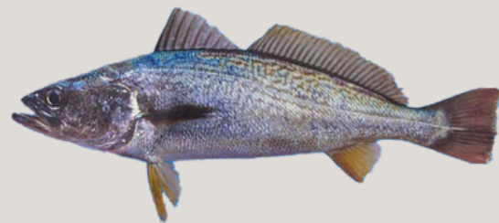
Nombre Común: Corvina