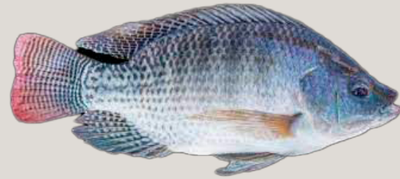
Nombre Común: Tilapia