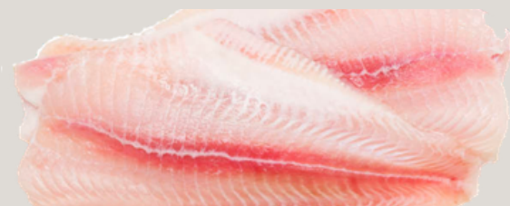
Nombre Común: Bagre