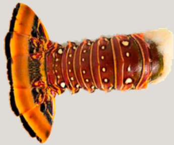
Nombre Común: Cola de Langosta del Caribe