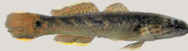
Nombre Común: Guabina