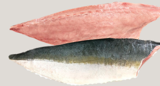
Nombre Común: Jurel